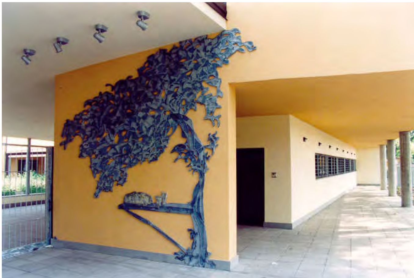
STUDIO SULLA VIA DELLA PACE Presentazione Curriculum professionale