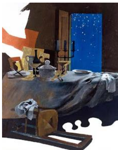
Immagine del Tavolo rovesciato per la cartolina